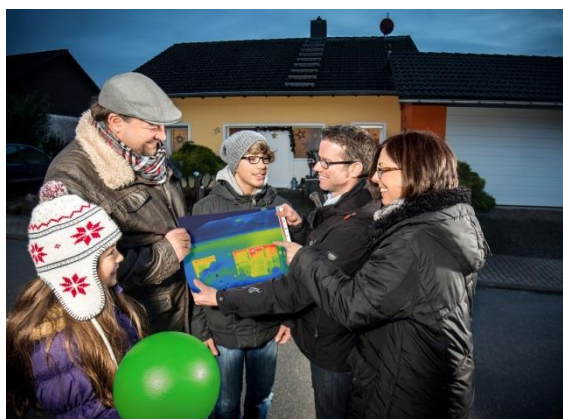
Große Resonanz für die Thermografie-Aktion